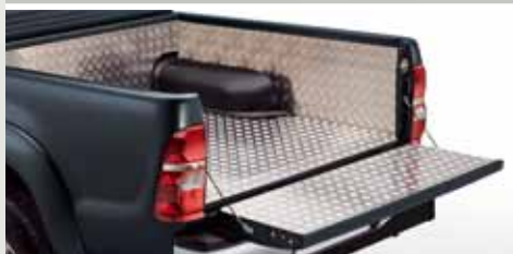
WYKŁADZINA ALUMINIOWA PRZESTRZENI BAGAŻOWEJ