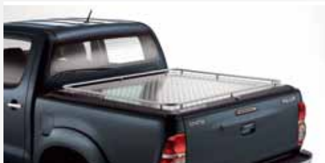
ALUMINIOWA OSŁONA PRZESTRZENI BAGAŻOWEJ