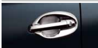
CHROMOWANE OBUDOWY KLAMEK