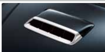
CHROMOWANA OBUDOWA WŁOTU POWIETRZA