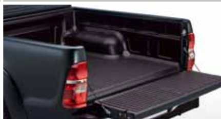
WYKŁADZINA PCV PRZESTRZENI BAGAŻOWEJ