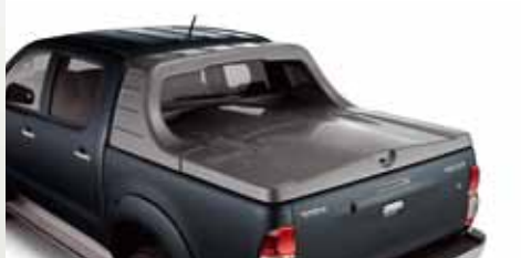
TWARDA OSŁONA PRZESTRZENI BAGAŻOWEJ