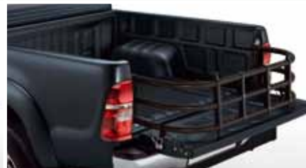
PRZEDŁUŻENIE PRZESTRZENI BAGAŻOWEJ