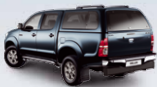
ZABUDOWA Z BOCZNYMI SZYBAMI