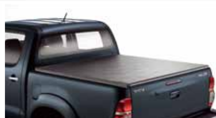
ELASTYCZNA OSŁONA PRZESTRZENI BAGAŻOWEJ