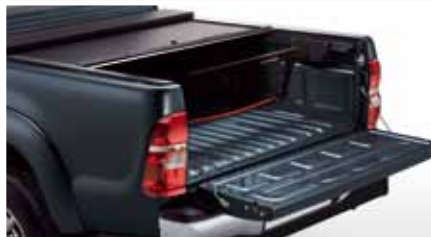
SYSTEM PODZIAŁU PRZESTRZENI BAGAŻOWEJ CARGO MANAGER