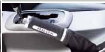
SKÓRZANA DŹWIGNIA HAMULCA RĘCZNEGO