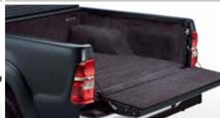
WYKŁADZINA WELUROWA PRZESTRZENI BAGAŻOWEJ