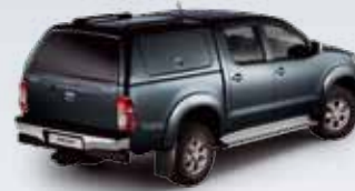
ZABUDOWA Z BOCZNYMI DRZWIČKAMI