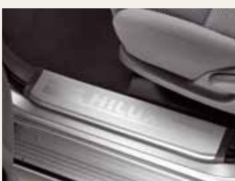
NAKŁADKI PROGOWE PRZEDNIE