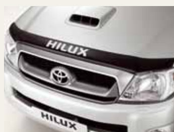
OWIEWKA NA MASKĘ