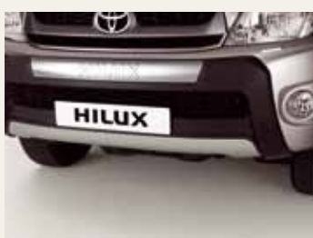
OSŁONA PRZEDNIEGO ZDERZAKA