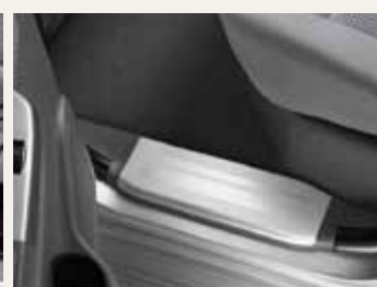
NAKŁADKI PROGOWE TYLNE