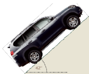
Zdolność pokonywania wzniesień