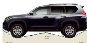
Kąty natarcia, rampowy i zejścia